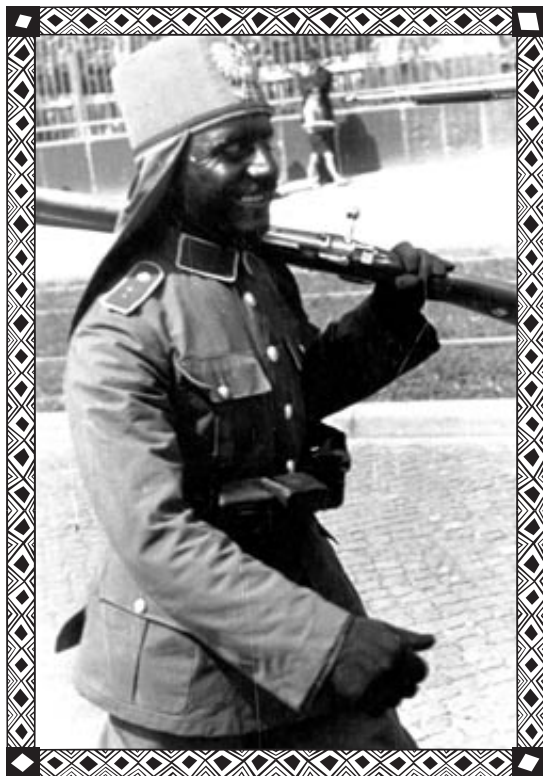
Żołnierz w pochodzie uzbrojony w karabin 7,9 mm Mauser wz. 1898 i pas z ładownicami