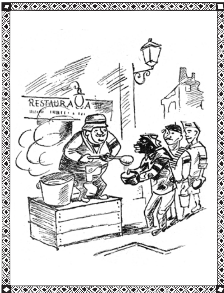
Ilustracja z książki Cafe „Pod Minogą” rys. J. Zaruba