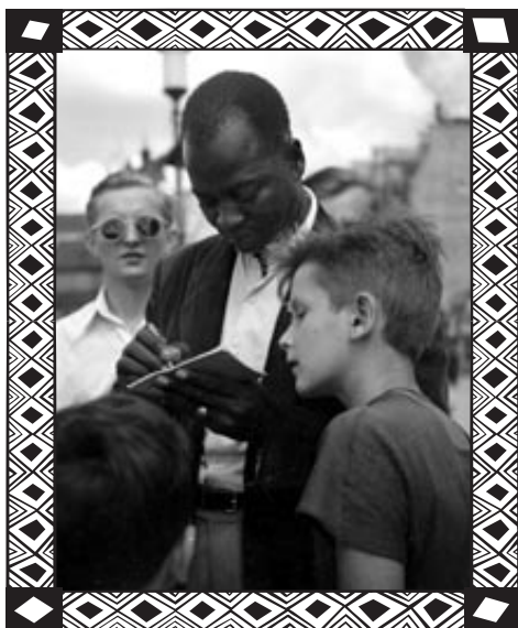
Delegat z Afryki na placu Zamkowym podczas rozdawania autografów.