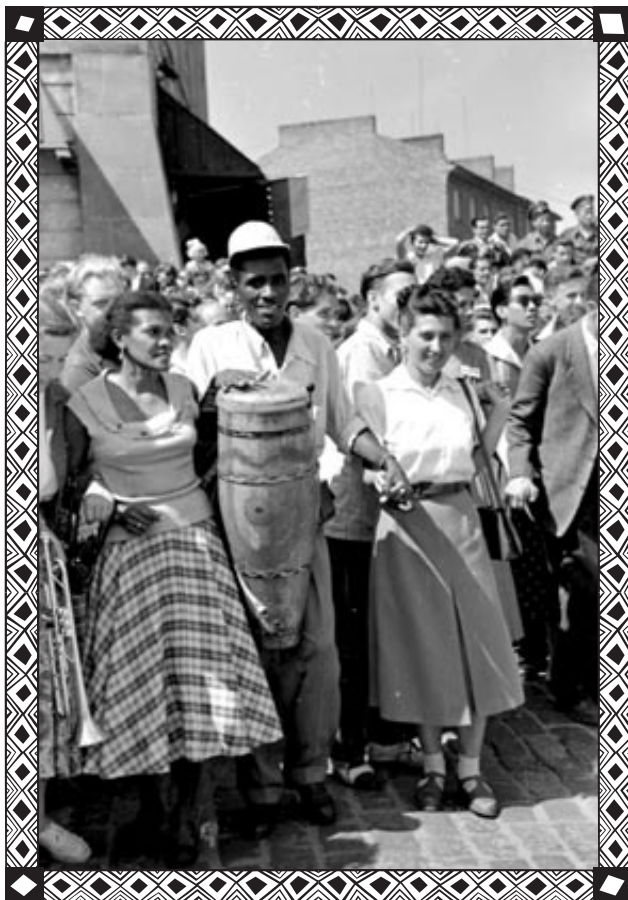
Grupa delegatów zagranicznych podczas zabawy na placu Zamkowym. Widoczny bęben afrykański.