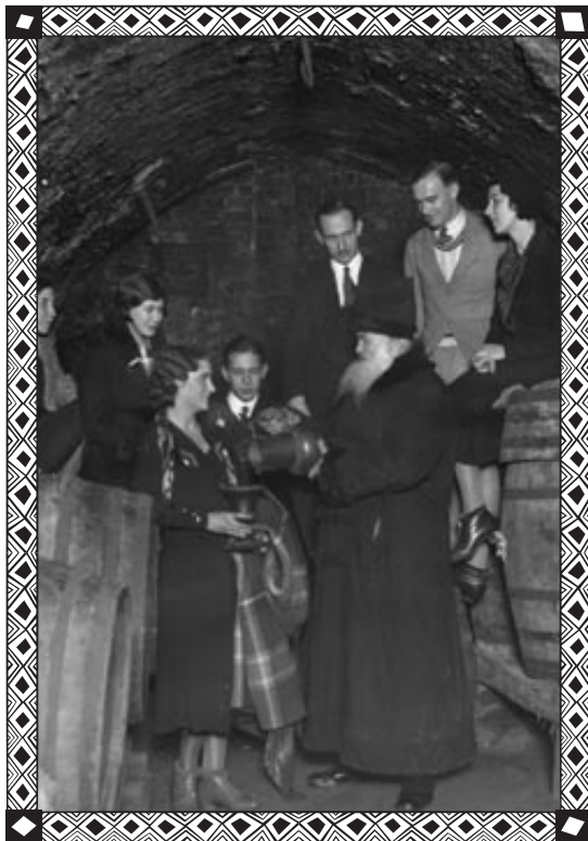
Potudniowoafrykańscy studenci w piwnicach winiarni Fukiera