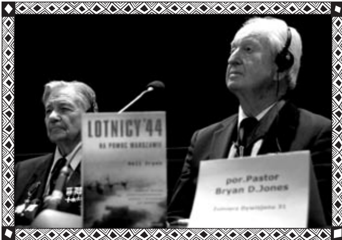
Południowoafrykańscy lotnicy w Warszawie w 2006 r.