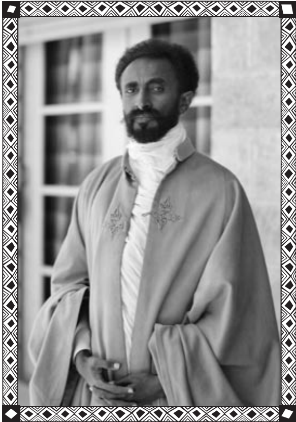
Haile Selassie, ©Library of Congress, CC