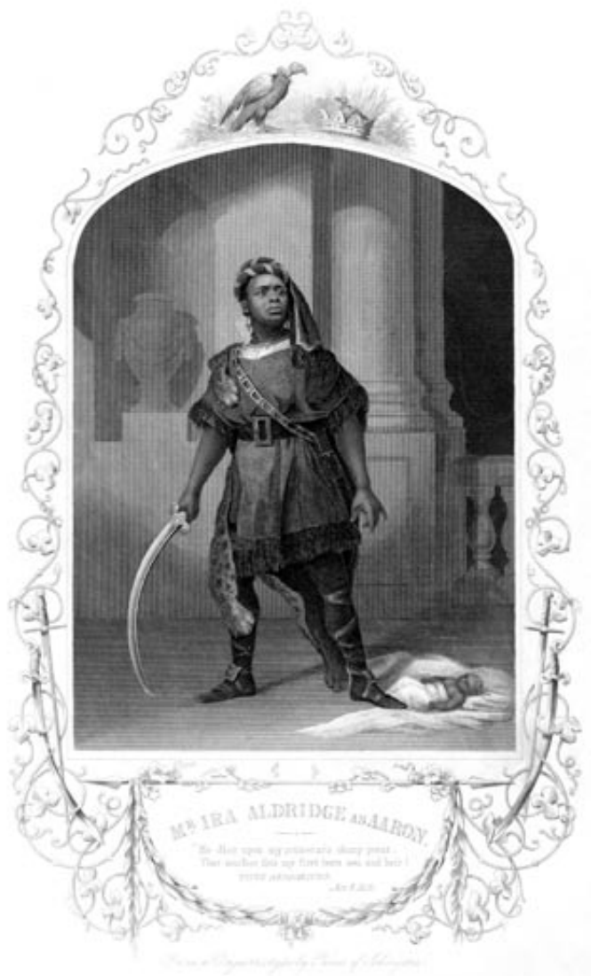
Ira Aldridge na scenie