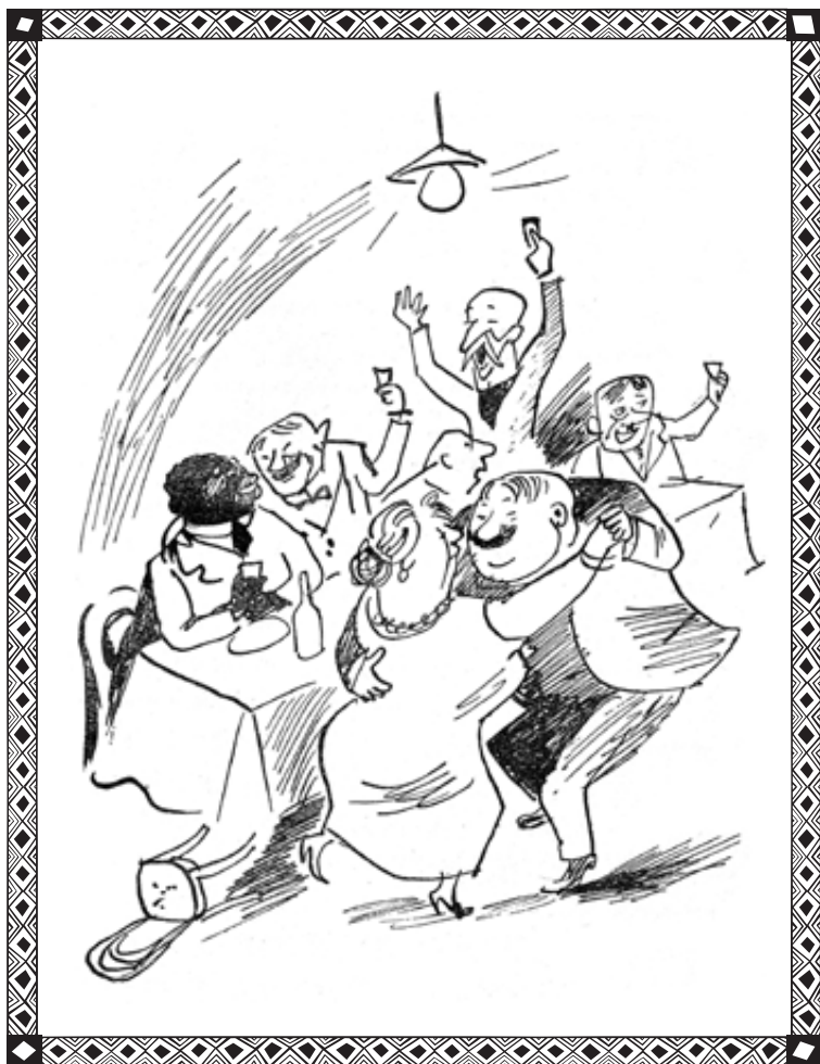
Ilustracja z książki Cafe „Pod Minogą” rys. J. Zaruba