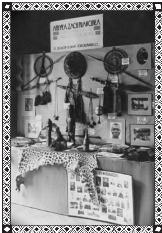
Eksponaty z Afryki Zachodniej