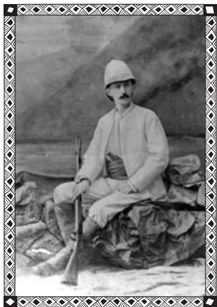
Stefan Szolc-Rogozieński - podróżnik, badacz Afryki i Kamerunu. Fotografia pozowana w atelier w stroju podróżniczym

W latach 80. XIX w. do grona założycieli kolonii zamorskich dołączył Stefan Szolc-Rogozieński, marynarz i podróżnik. Zainspirowany swoją wcześniejszą podróżą dookoła świata, zaplanował wyprawę do Kamerunu, która