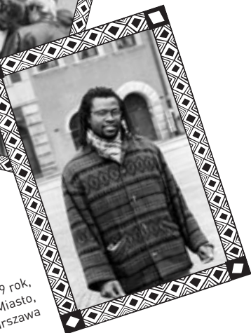
1989 rok, Stare Miasto, Warszawa