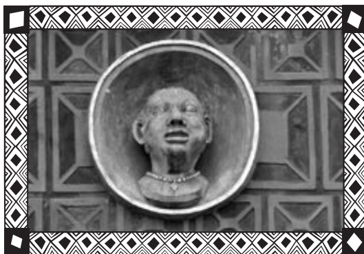
Kamienica „Pod Murzynkiem”, Warszawa © J. Szybińska