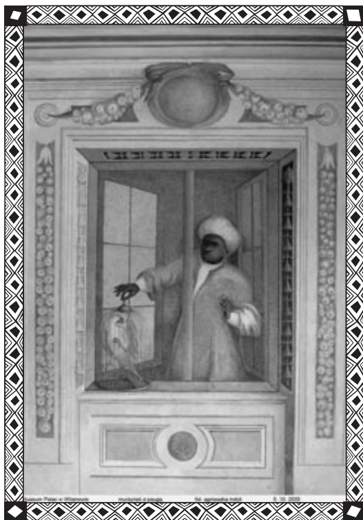
Giuseppe Rossi, „Murzynek z Papugą”, XVIII w., Patac w Wilanowie