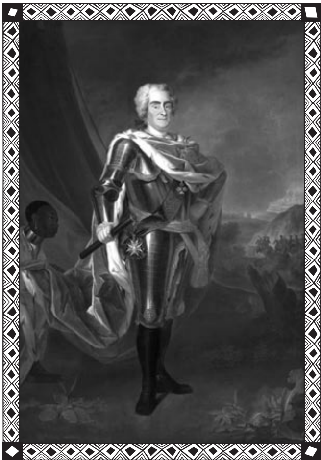
August II z Murzynkiem, ok. 1737 r., Pałac w Wilanowie