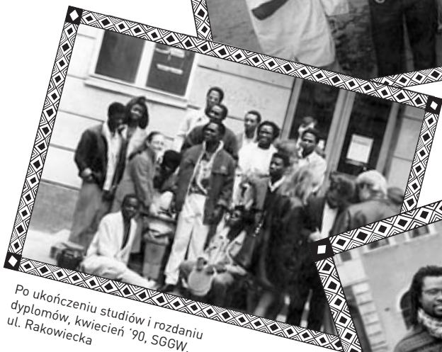
Po ukończeniu studiów i rozdaniu dyplomów, kwiecień '90, SGGW, ul. Rakowiecka