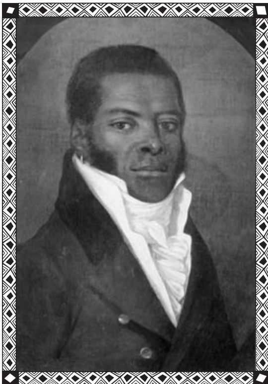
Portret Dominga (Jana Lapierre'a) służącego Kościuszki © Muzeum Wojska Polskiego w Warszawie, Jan Józef Sikorski